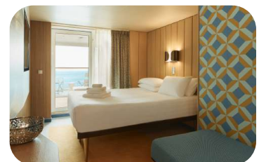
Καμπίνα με Μπαλκόνι